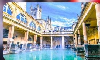
โรงอาบน้ำโรมันบาร