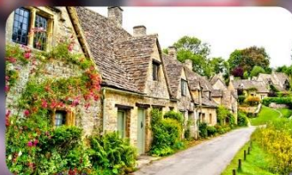
หมู่บ้านไบบิวรี่